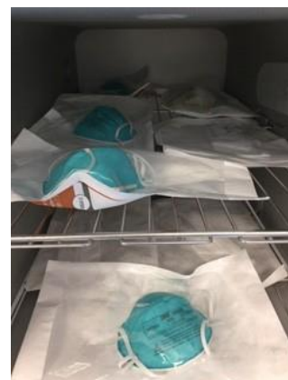
図 2：ロード用の N95 マスクの包装と棚への積載例