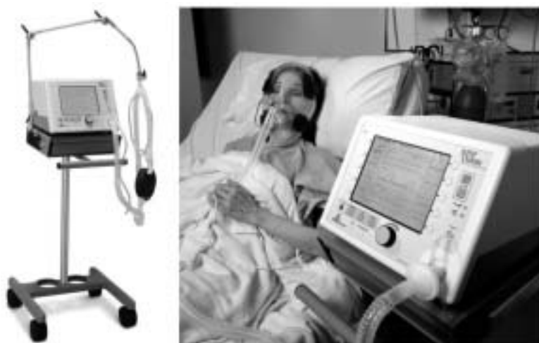
Fig. 1 Photographs of the noninvasive positive pressure ventilation device (BiPAP Vision)

収縮期雑音を聴取し、肺野に湿性ラ音を聴取した。僧帽弁逆流症に発作性心房細動を併発したために生じた心不全と判断し、全身へパリン化ののち、チオペンタールナトリウムで鎮静し、緊急に電氣的除細動(150J/1回)を施行した。洞調律に復した後に動悸は軽快したが、胸部X線写真で心拡大があり(Fig. 2-A)、頸静脈怒張、肺野の湿性ラ音も残存したため、即日、入院管理となった。