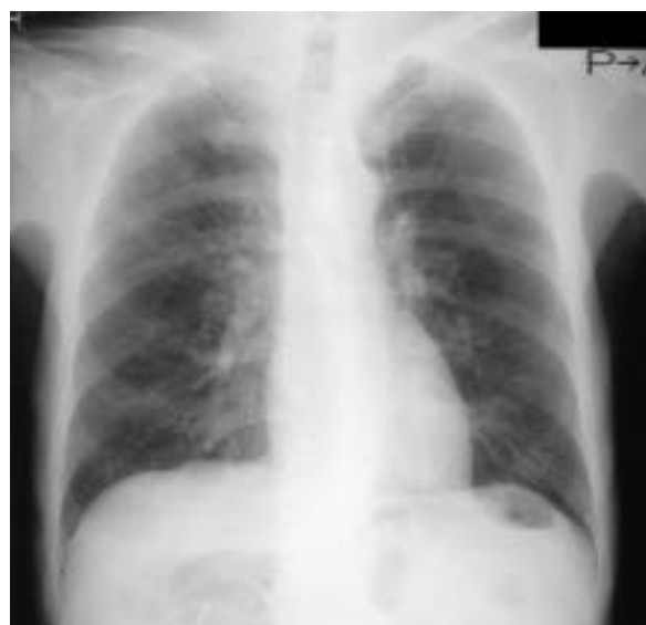
Fig. 1 Chest radiograph at the first admission

入院時検査所見: 胸部X線写真上, 心胸郭比は41%で肺うっ血などの異常所見はなかった(Fig. 1). 心電図では, V 1 , V 2 , aVL, V 4 -V 6 においてT波平低化を認め, V 5 , V 6 ではsagging typeのST低下も認められた(Fig. 2). 心エコー図上, 左室壁運動は正常で, 左室拡張末期径52mm, 左室収縮末期径33mm, 駆出率66%, 左房径41mm, 心室中隔壁厚10mm, 左室後壁厚10mm, E/A 0.76, 下大静脈の呼吸性変動あり, BNP 89.0pg/dlと併せて浮腫をきたすほどの心機能低下はないと判断した. 血液・尿所見ではTP 7.1g/dl, Alb 3.5g/dl, 尿蛋白(1+)で, 軽度の低アルブミン血症と蛋白尿を認めたが, 浮腫をきたすほどのものでは