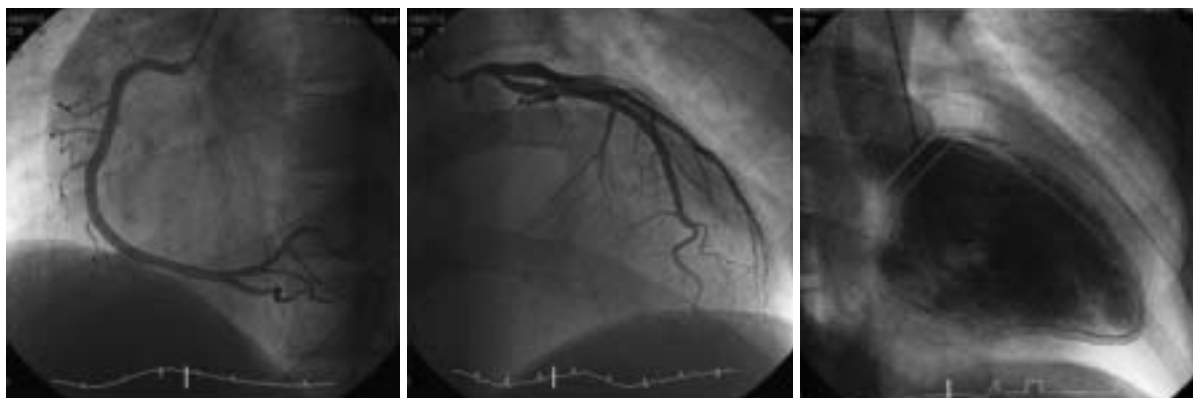
Fig. 1 Coronary angiograms and left ventriculogram