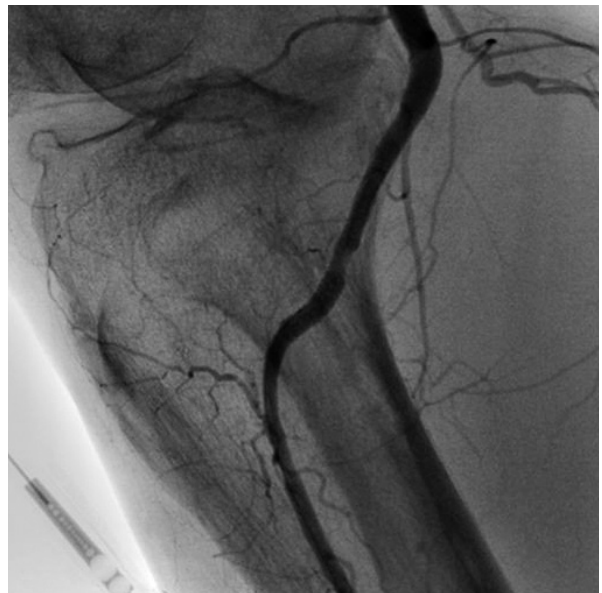
Fig. 5 Angiogram after placement of the polytetrafluoroethylene-covered stent demonstrating neither leakage of contrast nor stenotic lesion in the popliteal artery

テーテル治療目的に循環器内科紹介となった。我々は動脈狭窄部を解除することと穿孔部の止血を行うことの両方を目的とし、ステントグラフトを使用することとした。まず、6Fのシースを右浅大腿動脈より順行性に挿入し、6F Launcher JR4.0 guiding catheter (Boston scientific) を右浅大腿動脈に先進させた。BMW floppy wire (Guidant Corporation) では狭窄部の通過が困難であったため、Magic FA wire (Japan Lifeline) に変更し成功した。血管内エコー法 (intravascular ultrasound: IVUS) 所見では、狭窄部には多量の等エコー域のプラークを認めた。血管壁は最狭窄部で断裂し、血管外腔と交通しており (Fig. 4)、膝窩動脈の動脈硬化による動脈狭窄と狭窄部に一致する動脈穿孔と考えられた。3×20mm Ryujin balloon (Terumo) により6気圧で前拡張を行い、つぎに4×15mmのJostent Coronary Stent Graft (Jomed International AB) を18 atmで留置した。最終造影では造影剤の血管外漏出は認められず、膝窩動脈の狭窄も解除されていた (Fig. 5)。IVUSによってもステントグラフトの拡張は良好であり、穿孔部はステントグラフトにより完全にシールされており、血管腔と血管外腔との交通は認められなかった。膝関節の屈曲位、伸展位の透視像により膝窩部のステ