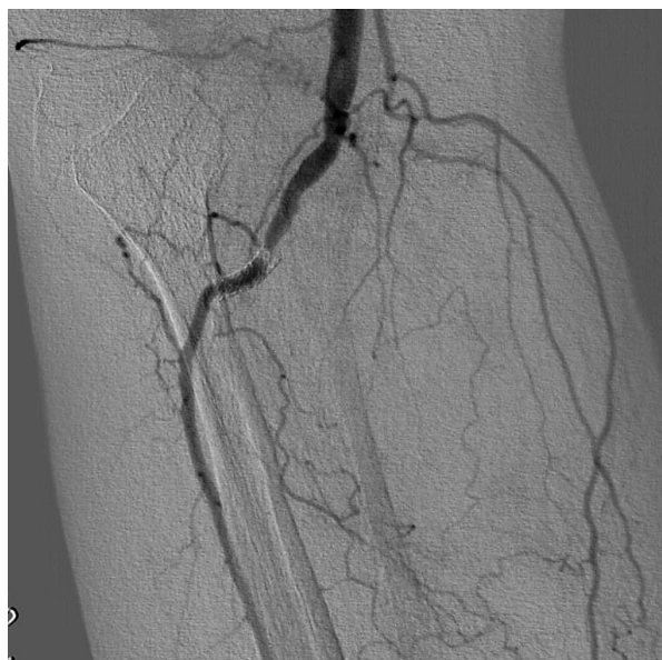
Fig. 6 Angiogram 6 months after treatments showing severe narrowing at the proximal edge of the polytetrafluoroethylene-covered stent There is no stent fracture.