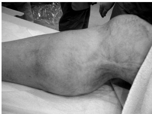
Fig. 1 Photograph of the right swollen calf

現病歴: 高血圧で近医通院中であったが，2005年6月頃より内服治療を自己中断していた。その後，右下肢の間欠性跛行を自覚し，右膝に鍼治療を受けた。その1週間後より右下腿の腫脹と疼痛を自覚し近医を受