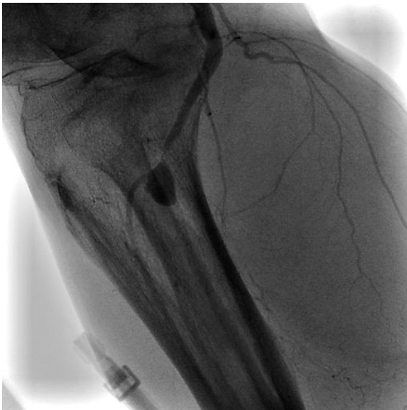
Fig. 3 Selective right femoral arteriogram revealing the aneurysm originating from the right popliteal artery with severe narrowing just proximal to the aneurysm Contrast filling into the aneurysm indicates that bleeding has persisted.